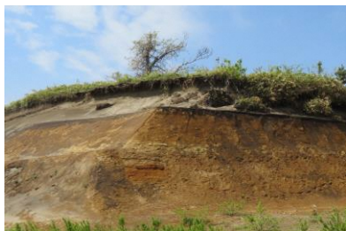
生痕化石と古砂丘観察