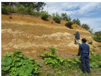
約 2 万年前の火山灰層の観察