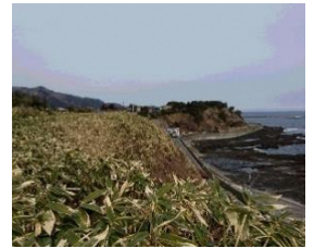
館の上御番所から中山崎を望む