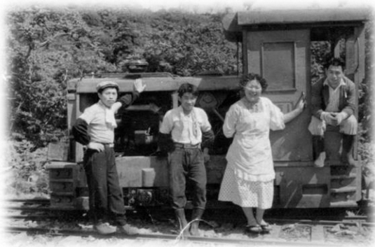
内燃機関車の前で

昭和10年から39年まで、老部川沿いに森林鉄道の機関車が約9kmの区間、天然ヒバ材を運んでいました。軌道跡の林道を自然観察しながら散策します。六ヶ所村の歴史や豊かな自然を体感しましょう！