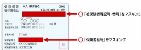
健康保険証のマスキング（例）