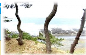
大砲台跡から海を臨む