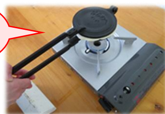
焼き型で作ります