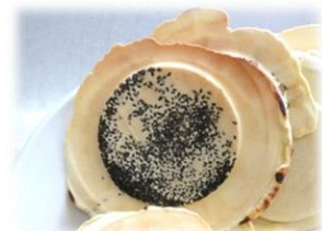
自分だけのオリジナルせんべい