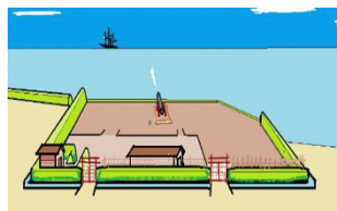
南方大砲台跡想像図