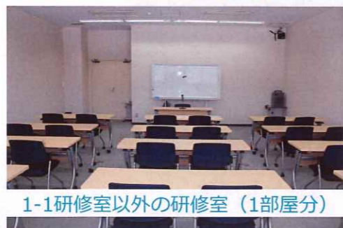
1-1研修室以外の研修室 (1部屋分)