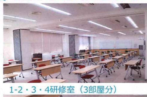
1-2・3・4研修室 (3部屋分)