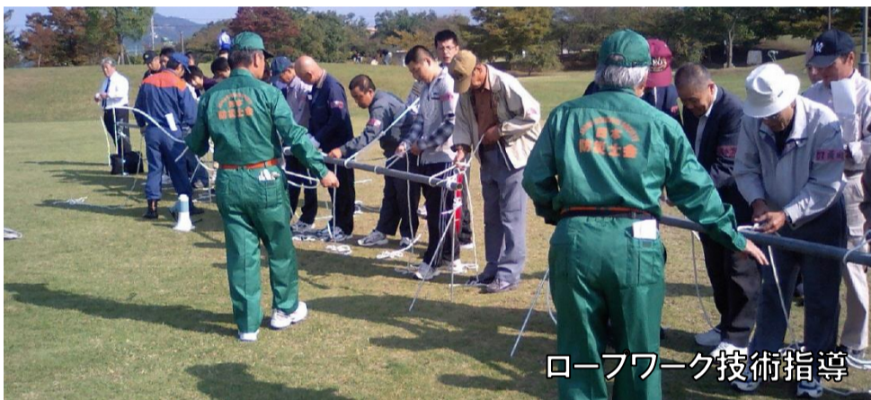
ロープワーク技術指導