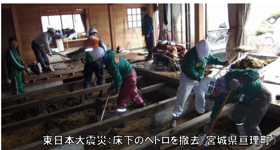
東日本大震災:床下のへド口を撤去(宮城県亘理町)