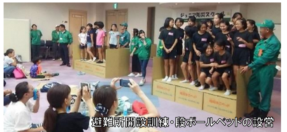
避難所開設訓練・段ボールベッドの設営