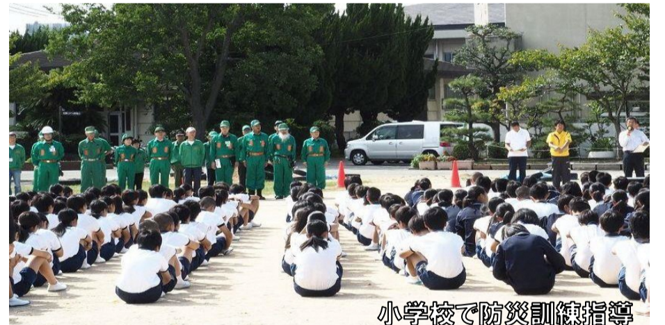
小学校で防災訓練指導