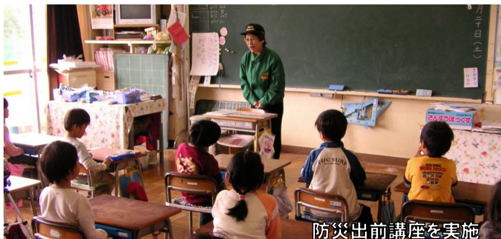
防災出前講座を実施