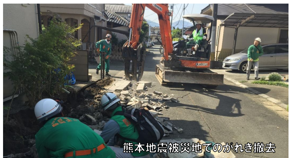
熊本地震被災地でのがれき撤去