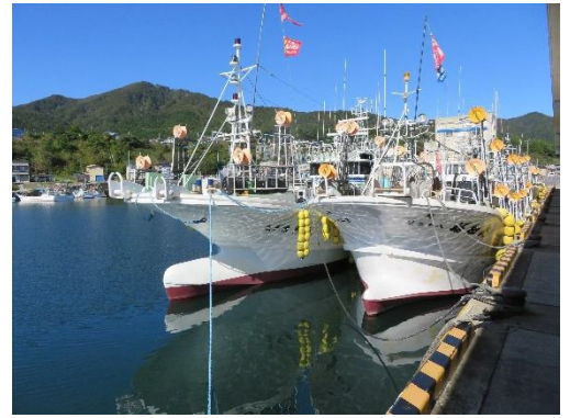
焼山漁港とイカ釣り船