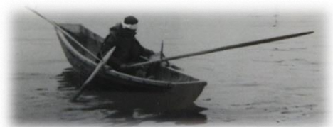
丸木舟でのアワビ漁