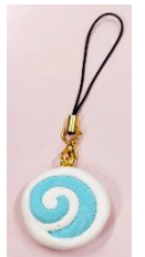
クジラ餅ストラップ