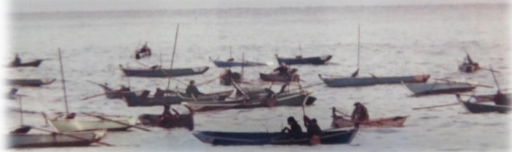
泊漁港付近でのアワビ漁の様子(カッコ船)