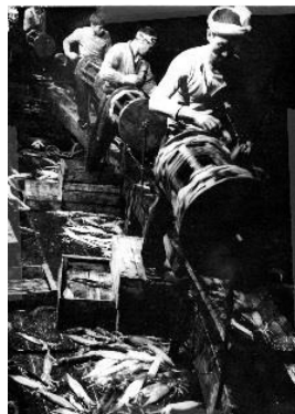
ドラム巻き式漁具でのイカ釣り 昭和30年代